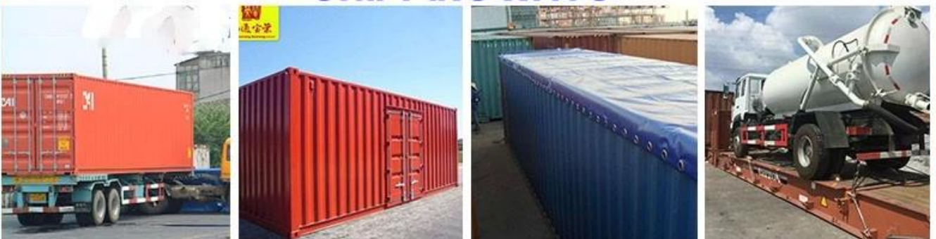
BY 20GP CONTAINER