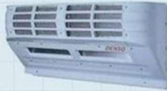
Integrated Evaporator + radiator