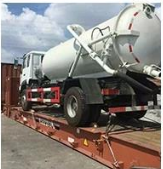
BY 20GP CONTAINER